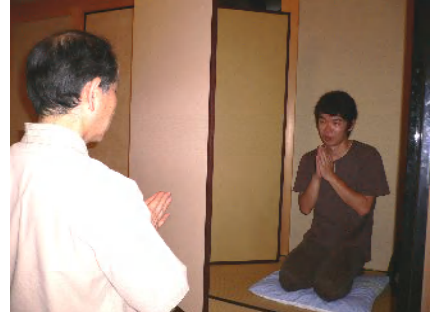
内観面接の様子 (合掌)

まず、所定の研修室に入ります。研修室の隅にはそれぞれ屏風が立てかけられており、中には座布団が敷かれています。どうぞ中に入り、座ってみてください。どのような形で座っても構いません。ご自分がリラックスできる姿勢でお願いします。