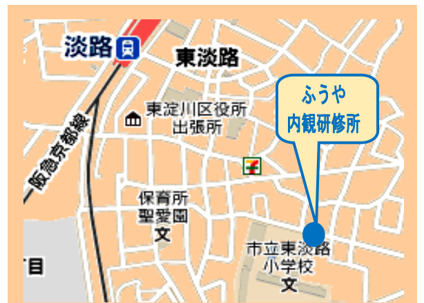
ふうや内観研修所 大阪市東淀川区東淡路 3-3-36